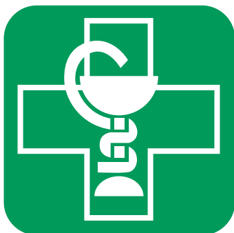
Renversé vert (version officielle)

Si le contexte de reproduction ne permet pas d'utiliser le symbole graphique dans sa version officielle, il est possible de le positionner en noir, en renversé ou en positif.